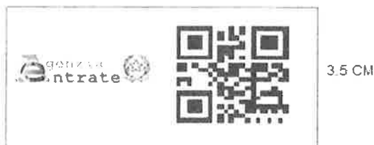
7 CM (3.5 logo Agenzia + 3.5 Qrcode)